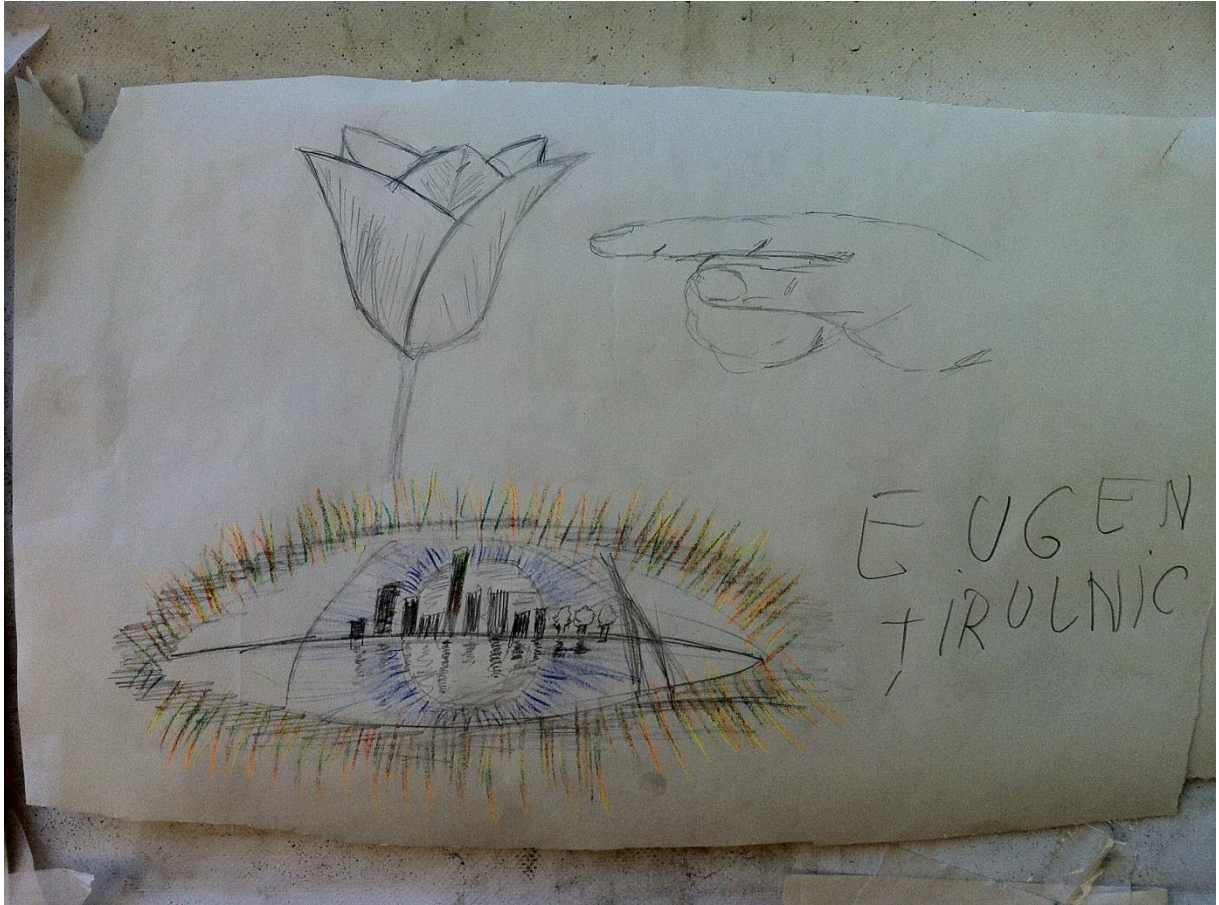
Cum e cartierul meu