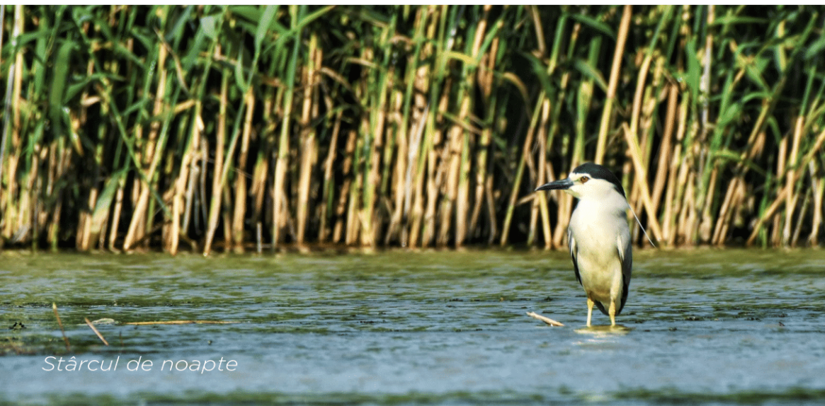
Stârcul de noapte

Suprafața generoasă a acestui teren permite ca aici să fie amenajate alei pietonale, piste pentru bicicliști, trotuare, spații verzi, pergole, scene, facilități pentru recreere pe terenurile amenajate (ex. zone special amenajate pentru sport și sporturi "extreme" - skatepark, traseu de BMX, panou de escaladă, locuri de joacă pentru copii, centru închiriere biciclete etc.). Râul Dâmbovița, care mărginește partea sudică a acestei zone ar putea, prin amenajare, să ofere o zonă de promenadă de peste 6 kilometri lungime și ar asigura apa necesară irigării parcului în perioadele calde și secetoase.”