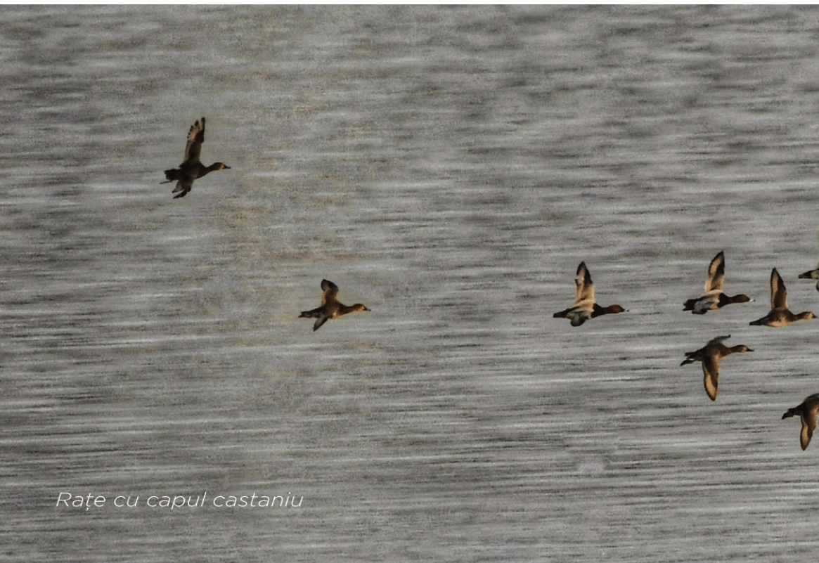
Rațe cu capul castaniu

Pe de altă parte, specificul terenului limitează opțiunile proprietarilor, aproximativ 100 de ha fiind în zona inundabilă a luncii Dâmboviței ceea ce nu permite dezvoltarea altor tipuri de amenajări sau activități, altele decât cele specifice de zonă umedă.